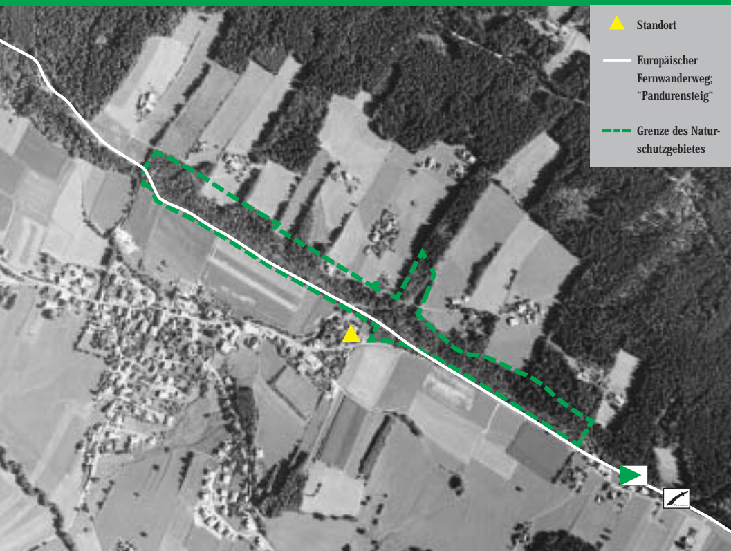
Bild Nr. 106, Bildflug Nr. 97 106/0